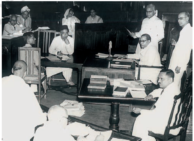
संविधान सभा में चर्चा की अध्यक्षता करते हुए डॉ. बी.आर. अंबेडकर

-डॉ. बी. आर. अंबेडकर संविधान सभा वाद-विवाद, खंड VII, पृष्ठ 37 4 नवंबर 1948